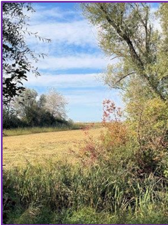
Durchs Bisenwäldli, einem Zugvogel- und Amphibien-Reservat von nationaler Bedeutung,