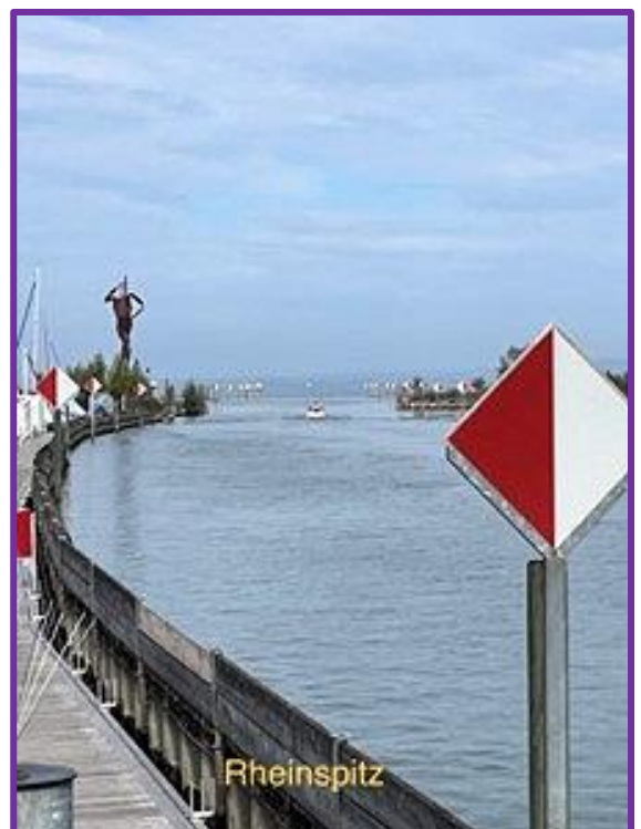
folgten wir dem alten Lauf des Rheins bis zum Rheinspitz.