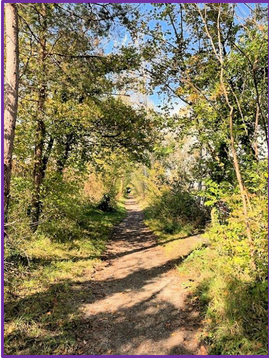
Ein steiler Weg führte uns hinunter nach Buriet und zum Naturschutzgebiet Altenrhein.