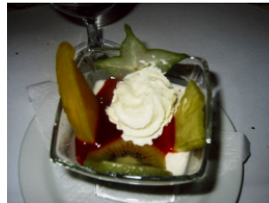
Das Menü: Vorspeise, Hauptgang, Dessert